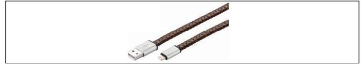
Fig.26: Figura del campione - Cavi di cuoio

Cavi di cuoio hanno gli stessi servizi cavo standard, ma sono rivestiti in pelle o ecopelle.