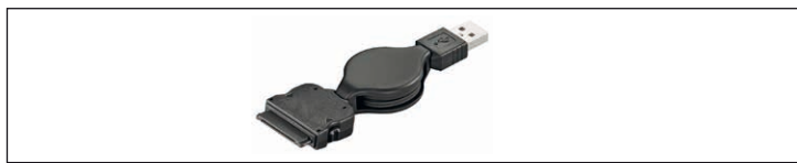
Fig.17: Figure échantillon - Câbles extensibles

câbles extensibles sont en charge des câbles et / ou de données qui sont compacts et ne lient pas.