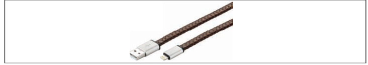
Fig.5: Beispielabbildung - Lederkabel

Lederkabel haben die gleiche Ausstattung wie Standardkabel, sind allerdings mit Leder oder Kunstleder ummantelt.