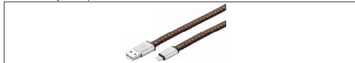
Fig.19: Figure échantillon - Câbles en cuir

Câbles en cuir ont les mêmes facilités que câble standard, mais sont recouverts de cuir ou cuir synthétique.