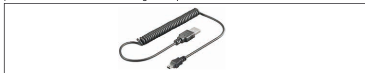
Fig.20: Figure échantillon - Câbles spirale

Câbles spirale sont de simples câbles de charge et / ou de données qui adaptent connecteurs spécifiques au fabricant à l'USB et donc permettent de charger et / ou d'échanger des données vers un PC ou d'autres appareils. La conception en spirale permet un fonctionnement et un gain de place.