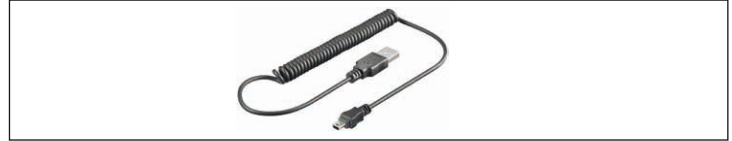
Fig.6: Beispielabbildung - Spiralkabel

Spiralkabel sind einfache Lade- und/oder Datenkabel, die von herstellerspezifischen Anschlüssen auf USB adaptieren und damit das Laden und/oder den Datenaustausch zu PC oder anderen Geräten ermöglichen. Die Spiralbauweise ermöglicht platzsparenden Betrieb und Lagerung.