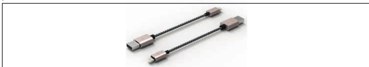
Fig.23: Figura del campione - Cavo ad alta potenza

Cavi di alta potenza sono in carica e il cavo dati, sono dotati di USB reversibile e / o le porte micro-USB e permettono la fruibilità a 180° su due lati particolarmente facile inserimento. cavi ad alta potenza sono progettati per correnti di carica superiori rispetto ai cavi standard.