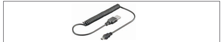
Fig.27: Figura del campione - Cavi a spirale

Cavi a spirale sono semplici cavi di ricarica e / o di dati ha adattare i connettori specifici del costruttore per USB e diceva così permettono di caricare e / o per lo scambio di dati ad un PC o ad altri dispositivi. Il disegno a spirale permette risparmio di spazio operativo e di stoccaggio.