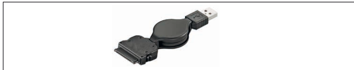
Fig.3: Beispielabbildung - Ausziehbare Kabel

Ausziehbare Kabel sind Lade- und/oder Datenkabel, die platzsparend sind und nicht verknoten.