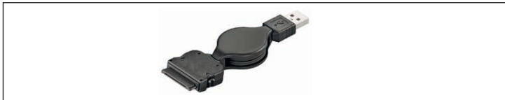
Fig.24: Figura del campione - Cavi allungabili

Cavi allungabili sono in carica e / o cavi dati hanno fatto sono compatti e non legare. 2 diversi in 1 cavi sono dotati di 2, connettori specifici del produttore sul loro lato di uscita e di adattarsi alle USB.