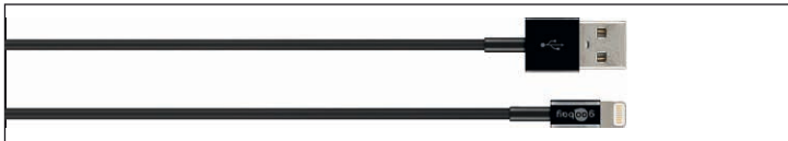
Fig.22: Figura del campione - Cavi standard

Cavi standard sono semplici cavi di ricarica e / o di dati che si adattano le connessioni proprietarie a USB e quindi permettono di scaricare e / o lo scambio di dati a PC o altri dispositivi. La velocità di trasferimento dati massima è sempre più lenti standard di connessione installate.