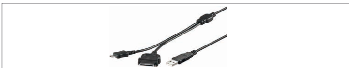
Fig.25: Figura del campione - 2 in 1 cavi

2 in 1 cavi sono dotati di 2 diversa connettori specifici del produttore sul loro lato di uscita e di adattarsi alle USB.