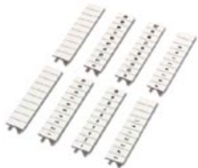
Marker for terminal blocks

Please be informed that the data shown in this PDF Document is generated from our Online Catalog. Please find the complete data in the user's documentation. Our General Terms of Use for Downloads are valid ( http://phoenixcontact.com/download )