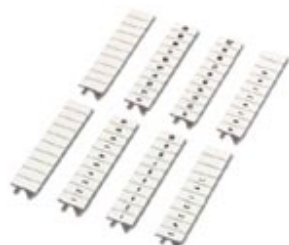
Zack marker strip, 10-section, horizontally labeled with the consecutive numbers: 11 ... 20, white, Width: 5 mm

Please be informed that the data shown in this PDF Document is generated from our Online Catalog. Please find the complete data in the user's documentation. Our General Terms of Use for Downloads are valid ( http://phoenixcontact.com/download )