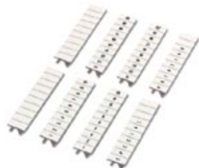
Zack marker strip, 10-section, horizontally labeled with the consecutive numbers: 31 ... 40, white, Width: 5 mm

Please be informed that the data shown in this PDF Document is generated from our Online Catalog. Please find the complete data in the user's documentation. Our General Terms of Use for Downloads are valid ( http://phoenixcontact.com/download )