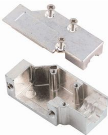
Slide Lock Version