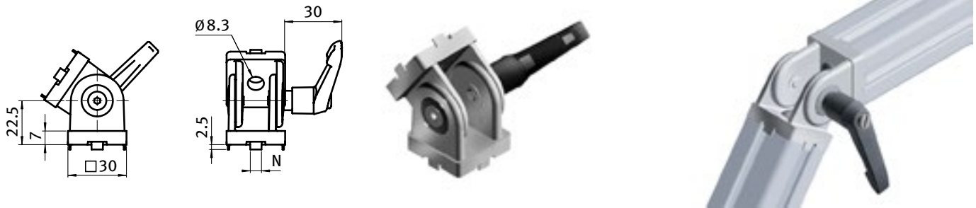
Gelenk 30 mit Klemmhebel Pivot Joint 30 with Locking Lever

Description Die-cast Zinc To make a pivoting connection between 2 profiles or panels which can be fixed at any angle; fixed locating pins for slot 6 or 8 optional; by tightening or loosening the screws and the \mathcal{M}_{6mm} -locking lever you can seamlessly regulate the functionality of the joint or you can fix it in one position Material Joint: Die-cast zinc \mathcal{M}_{6mm} -locking lever: Nylon PA, glass fibre reinforced Surface Alu color laquered Pack Quantity 10 pieces Specials Other surfaces, other colors on request