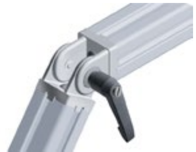
Gelenk 40 mit Klemmhebel Pivot Joint 40 with Locking Lever