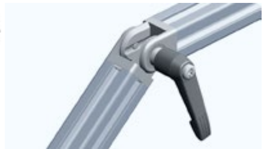
Gelenk 20 mit Klemmhebel Pivot Joint 20 with Locking Lever