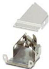
D-SUB EMC inner sleeve, shell size 2, shielded, for sleeve housing VS-15-...

Please be informed that the data shown in this PDF Document is generated from our Online Catalog. Please find the complete data in the user's documentation. Our General Terms of Use for Downloads are valid ( http://phoenixcontact.com/download )