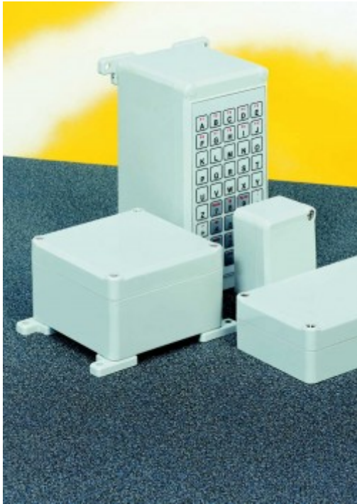
Euromas II, lid with membrane area