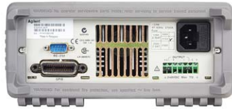
E3640A – E3645A