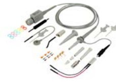
GE 5011 PRO

FTsondes F00 - Les spécifications peuvent être modifiées sans préavis