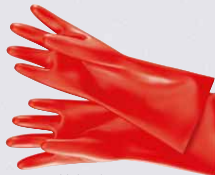
98 65 40