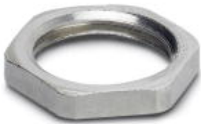
Flat nut with M16 thread

Please be informed that the data shown in this PDF Document is generated from our Online Catalog. Please find the complete data in the user's documentation. Our General Terms of Use for Downloads are valid ( http://phoenixcontact.com/download )