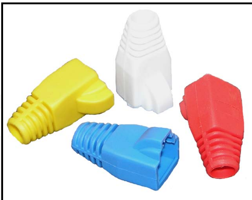
Strain Relief Over Boots (PS2* + PS2*6)