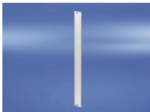
Illustration shows front panel 6 U, 4 HP