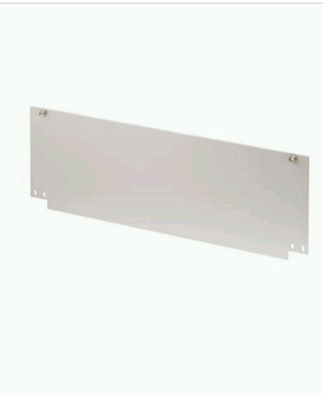
Illustration shows full-width front panel with height 3 U

CHANGING AN ITEM WILL UPDATE THE CATALOG NUMBER. THIS CAN AFFECT THE LIST PRICE AND SPECIFICATION OF THE ITEM.