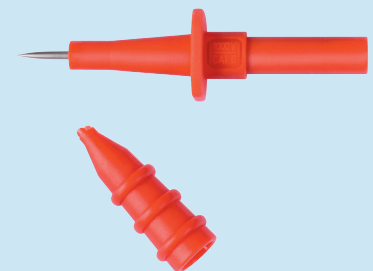
SPS 2590 /..(Farbe) SPS 2590 /..(colour)