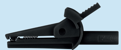
SAK 6716 / 4 /..(Farbe) SAK 6716 / 4 /..(colour)