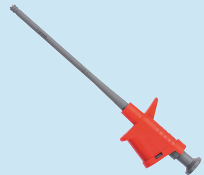
KPS 6755 /..(Farbe) KPS 6755 /..(colour)