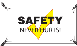
106330 3' x 5' vinyl