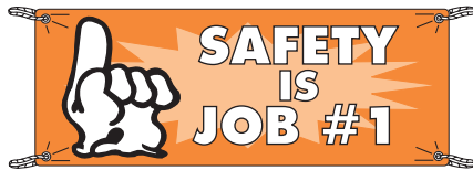
106292 3.5' x 10' vinyl