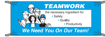
106303 3.5' x 10' vinyl