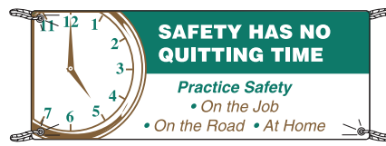
106329 3' x 5' vinyl