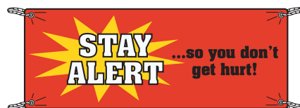
106300 3.5' x 10' vinyl