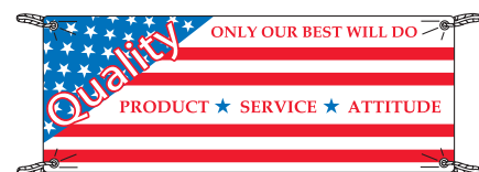
106327 3.5' x 10' vinyl