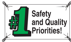
106332 3' x 5' vinyl