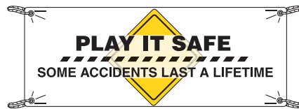
106325 3.5' x 10' vinyl