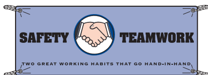
106299 3.5' x 10' vinyl