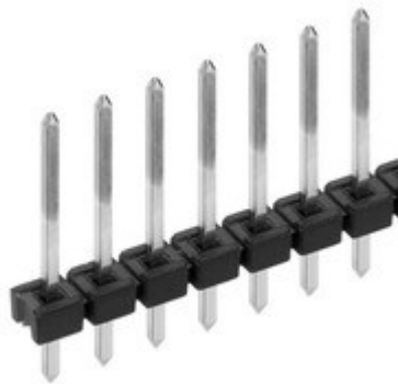
PCB connectors > Male headers Low profile, straight, \square 0.635 mm