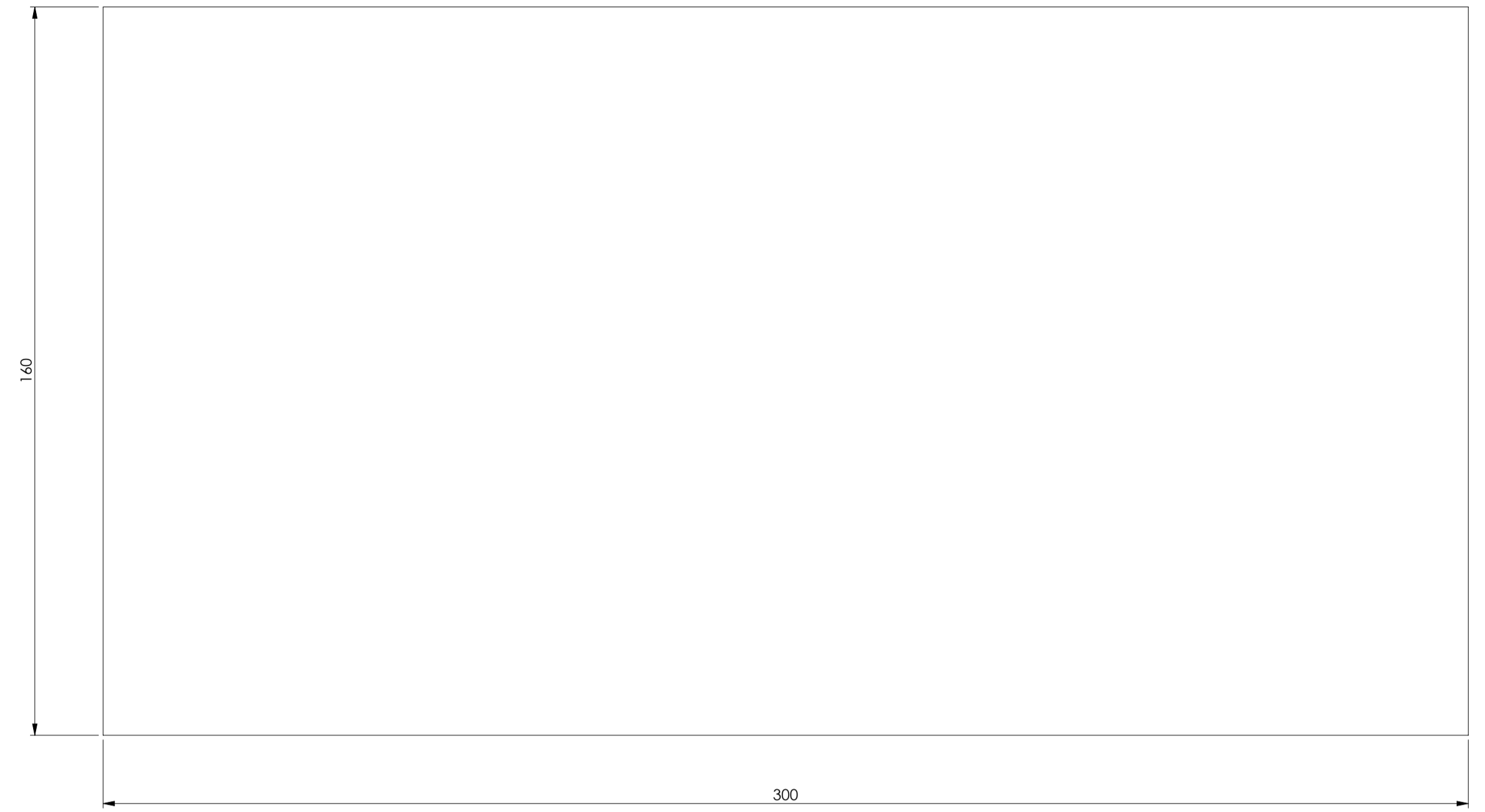
MAX PCB SIZE