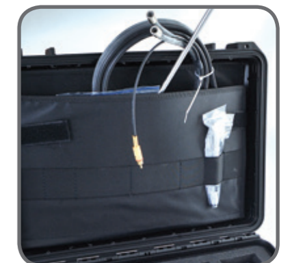
Tasca multiuso Internal pocket organizer