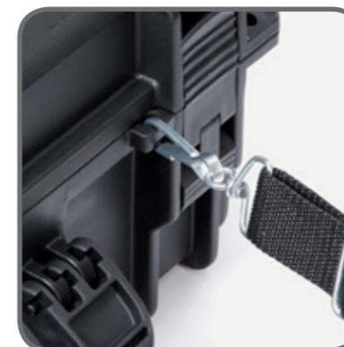
Aggancio tracolla Shoulder strap hook