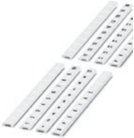
Zack marker strip flat, 10-section, horizontally labeled with the consecutive numbers: 1 ... 10, white, Width: 8 mm

Please be informed that the data shown in this PDF Document is generated from our Online Catalog. Please find the complete data in the user's documentation. Our General Terms of Use for Downloads are valid ( http://phoenixcontact.com/download )