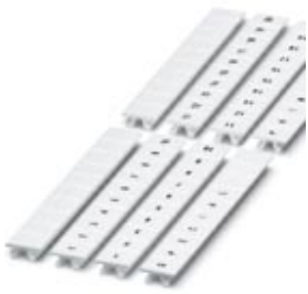
Zack marker strip, 10-section, horizontally labeled with the consecutive numbers: 11 ... 20, white, Width: 8 mm

Please be informed that the data shown in this PDF Document is generated from our Online Catalog. Please find the complete data in the user's documentation. Our General Terms of Use for Downloads are valid ( http://phoenixcontact.com/download )