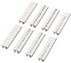
Zack marker strip, 10-section, horizontally labeled with the consecutive numbers: 21 ... 30, white, Width: 5 mm

Please be informed that the data shown in this PDF Document is generated from our Online Catalog. Please find the complete data in the user's documentation. Our General Terms of Use for Downloads are valid ( http://phoenixcontact.com/download )