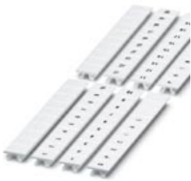
Zack marker strip, 10-section, horizontally labeled with the consecutive numbers: 21 ... 30, white, Width: 8 mm

Please be informed that the data shown in this PDF Document is generated from our Online Catalog. Please find the complete data in the user's documentation. Our General Terms of Use for Downloads are valid ( http://phoenixcontact.com/download )