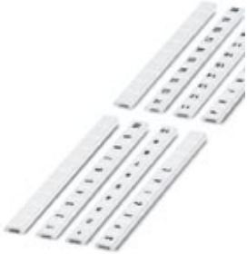
Zack marker strip flat, 10-section, horizontally labeled with the consecutive numbers: 21 ... 30, white

Please be informed that the data shown in this PDF Document is generated from our Online Catalog. Please find the complete data in the user's documentation. Our General Terms of Use for Downloads are valid ( http://phoenixcontact.com/download )