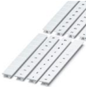
Zack marker strip, 10-section, horizontally labeled with the consecutive numbers: 31 ... 40, white

Please be informed that the data shown in this PDF Document is generated from our Online Catalog. Please find the complete data in the user's documentation. Our General Terms of Use for Downloads are valid ( http://phoenixcontact.com/download )