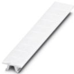
Zack marker strip, 10-section, horizontally labeled with the consecutive numbers: 31 ... 40, white, Width: 6 mm

Please be informed that the data shown in this PDF Document is generated from our Online Catalog. Please find the complete data in the user's documentation. Our General Terms of Use for Downloads are valid ( http://phoenixcontact.com/download )