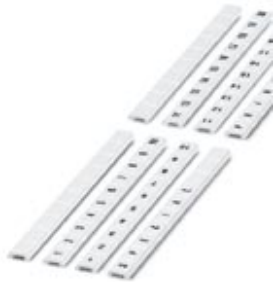
Zack marker strip flat, 10-section, horizontally labeled with the consecutive numbers: 31 ... 40, white

Please be informed that the data shown in this PDF Document is generated from our Online Catalog. Please find the complete data in the user's documentation. Our General Terms of Use for Downloads are valid ( http://phoenixcontact.com/download )