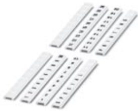
Zack marker strip flat, 10-section, horizontally labeled with the consecutive numbers: 31 ... 40, white

Please be informed that the data shown in this PDF Document is generated from our Online Catalog. Please find the complete data in the user's documentation. Our General Terms of Use for Downloads are valid ( http://phoenixcontact.com/download )