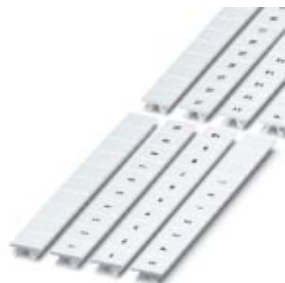
Zack marker strip, 10-section, horizontally labeled with the consecutive numbers: 41 ... 50, white

Please be informed that the data shown in this PDF Document is generated from our Online Catalog. Please find the complete data in the user's documentation. Our General Terms of Use for Downloads are valid ( http://phoenixcontact.com/download )