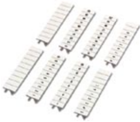
Zack marker strip, 10-section, horizontally labeled with the consecutive numbers: 41 ... 50, white, Width: 5 mm

Please be informed that the data shown in this PDF Document is generated from our Online Catalog. Please find the complete data in the user's documentation. Our General Terms of Use for Downloads are valid ( http://phoenixcontact.com/download )