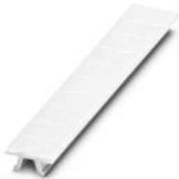
Zack marker strip, 10-section, horizontally labeled with the consecutive numbers: 41 ... 50, white, Width: 6 mm

Please be informed that the data shown in this PDF Document is generated from our Online Catalog. Please find the complete data in the user's documentation. Our General Terms of Use for Downloads are valid ( http://phoenixcontact.com/download )