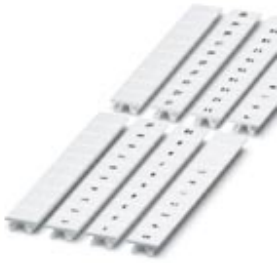
Zack marker strip, 10-section, horizontally labeled with the consecutive numbers: 41 ... 50, white, Width: 8 mm

Please be informed that the data shown in this PDF Document is generated from our Online Catalog. Please find the complete data in the user's documentation. Our General Terms of Use for Downloads are valid ( http://phoenixcontact.com/download )