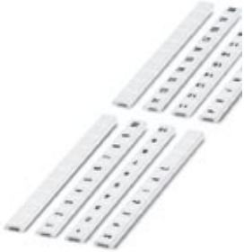
Zack marker strip flat, 10-section, horizontally labeled with the consecutive numbers: 41 ... 50, white

Please be informed that the data shown in this PDF Document is generated from our Online Catalog. Please find the complete data in the user's documentation. Our General Terms of Use for Downloads are valid ( http://phoenixcontact.com/download )