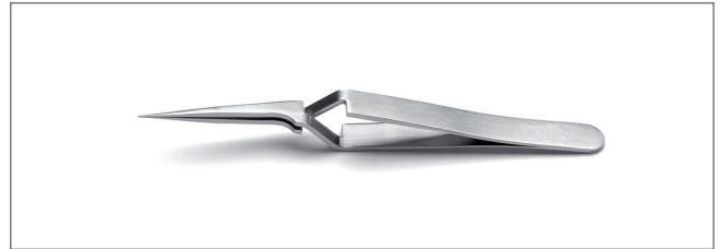
5AX.SA Tips: straight, extra fine. OAL: 110mm