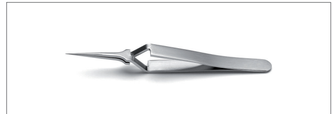
5X.SA Tips: straight, extra fine. OAL: 110mm