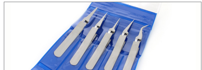
K5PINX Kit of 5 tweezers: 2AX, 3X, 5X, 5AX, 7X