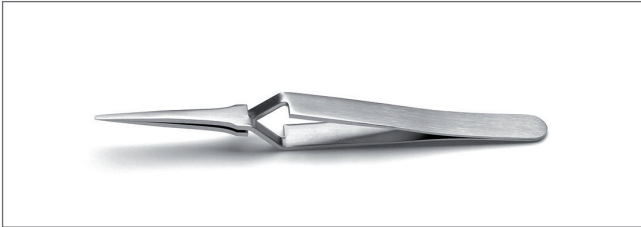
2AX.SA Tips: straight, flat, round. OAL: 120mm