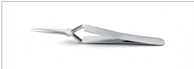
5TTHX.SA Tips: straight, extra fine. OAL: 110mm