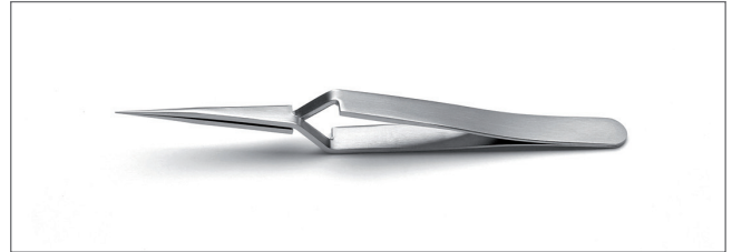
3X.SA Tips: straight, extra fine. OAL: 120mm