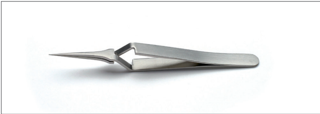
4X.SA Tips: straight, extra fine. OAL: 105mm