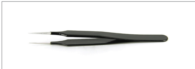
DT000009 Tips: straight, fine. OAL: 110mm