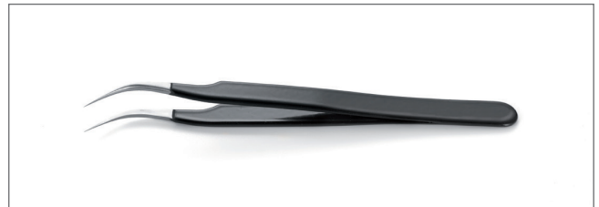
DT000011 Tips: fine, curved. OAL: 120mm