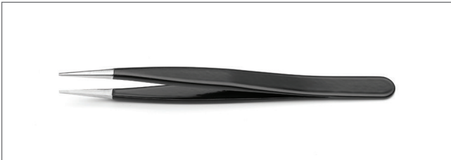
DT000005 Tips: straight, strong, thick. OAL: 120mm