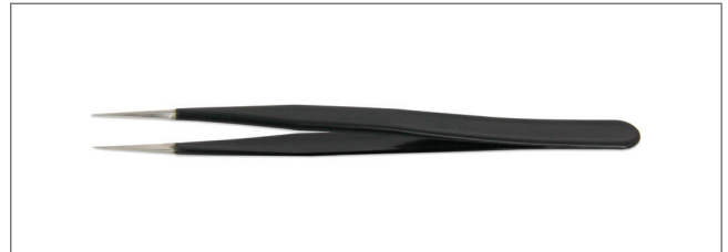
DT000006 Tips: straight, fine. OAL: 125mm