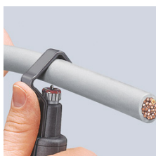
påsetting av verktøyet for omfangsnett