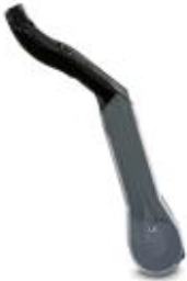
Ferrule magazine for CRIMPFOX 4 IN 1, for ferrules with insulating collars from 0.5 mm 2 ... 2.5 mm 2 , with a length of 8 mm

Please be informed that the data shown in this PDF Document is generated from our Online Catalog. Please find the complete data in the user's documentation. Our General Terms of Use for Downloads are valid ( http://phoenixcontact.com/download )