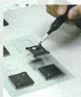
Possible lifting needles (option):