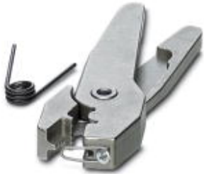
Replacement die for ZAP 25 and ZAP 25 T crimping pliers, with spring, pivot pin, finger guard, and hexagonal nut.

Please be informed that the data shown in this PDF Document is generated from our Online Catalog. Please find the complete data in the user's documentation. Our General Terms of Use for Downloads are valid ( http://phoenixcontact.com/download )