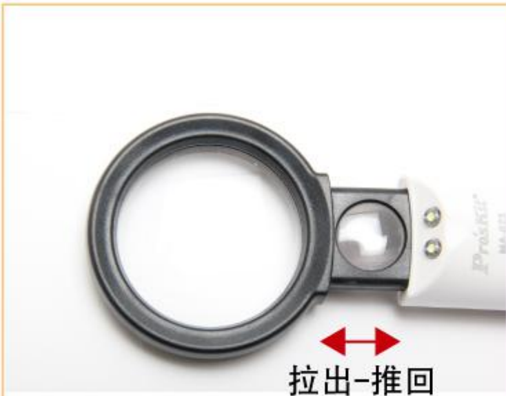
伸缩式双倍率镜片设计