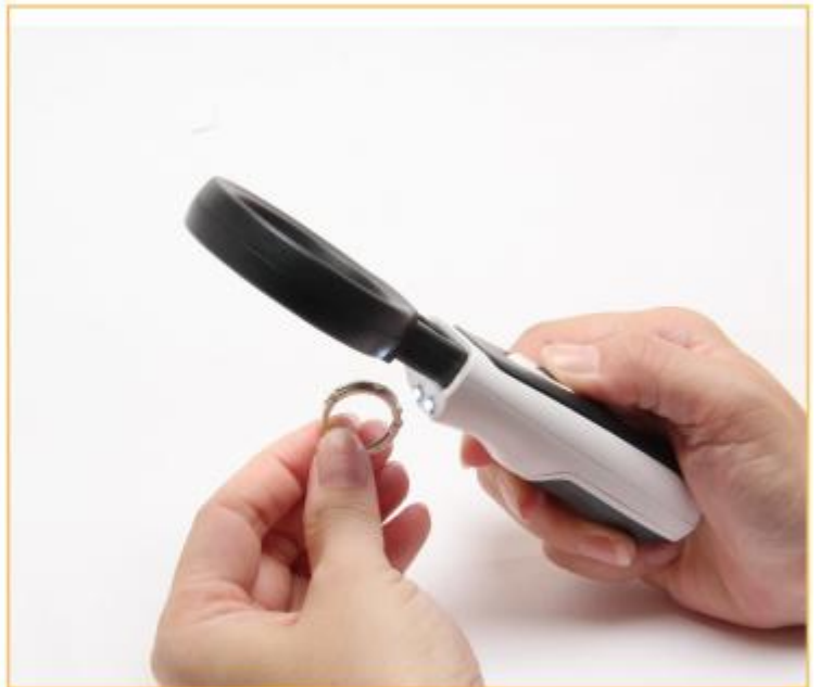
珠宝等细微工作检示