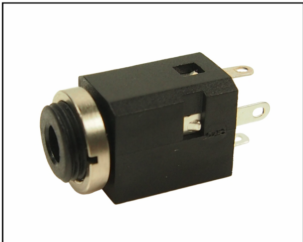
Part No. FC681374V