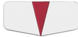
Indicator arrow GN 711.1