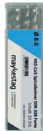
Gewerbepack Industrial packing Paquete industrial