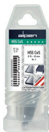
Drehpack mit Aufhänger Twistpack with tag Paquete giratorio con gancho para autoservicio