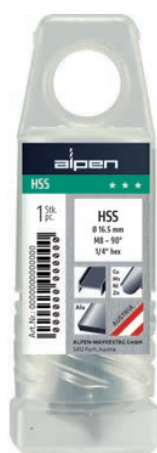
Drehpack mit Aufhänger Twistpack with tag Paquete giratorio con gancho para autoservicio