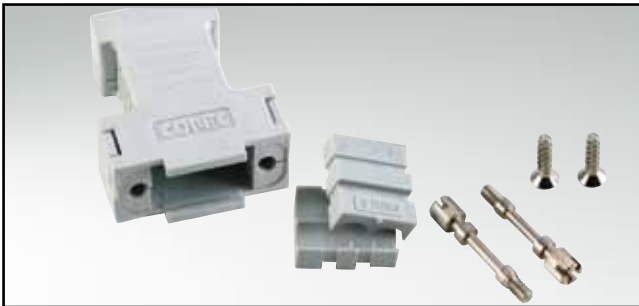
RoHS compliant – CSA listed, File No.: LR 115000-1 – UL listed, File No.: E202784

Design for power 2W2 Combination D-SUB Connectors – Wire size AWG 8...20