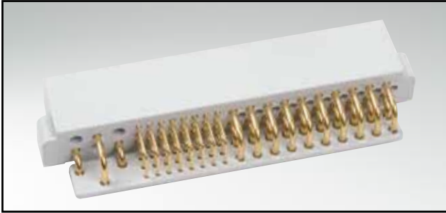
RoHS compliant – UL listed, File no.: E228329

Male connector – solder pin – angled – precision machined contacts – 47 positions