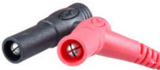
▲ 防尘防氧化插头塞